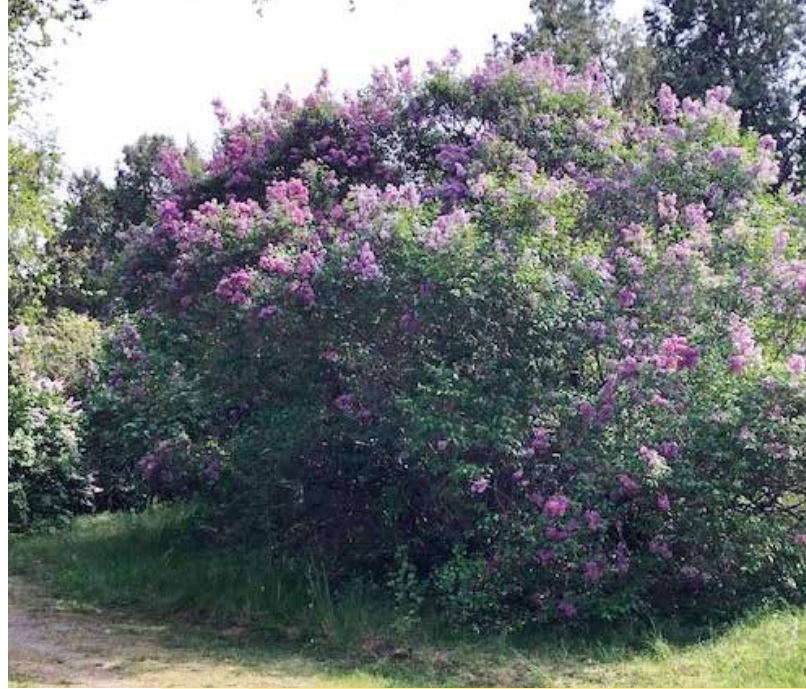
Fliederblüte im Friedhof St. Marx

Gottes Schöpfung schillert in vielen Farben, gerade auch die Blüten in all ihren Formen bereiten immer wieder große Freude und lassen einen geradezu andächtig werden. So ist auch Traude , 61 Jahre, fasziniert von der Farbenpracht blühender Büsche wie auf dem alten Friedhof St. Marx . Der Friedhof hat für sie eine ganz eigene Energie. Er ist schon lange stillgelegt, die alten Grabsteine vielfach zerstört und verwittert. „Man kann sich in eine vergangene Zeit, in Bruchstücke anderer Leben hineinversetzen. Über und über ist der Friedhof mit Fliederbüschen bewachsen und zur Hauptblütezeit duftet alles geradezu betörend. Der Gegensatz zwischen blühender Natur und Vergänglichkeit übt auf mich eine ganz besondere Faszination aus.“