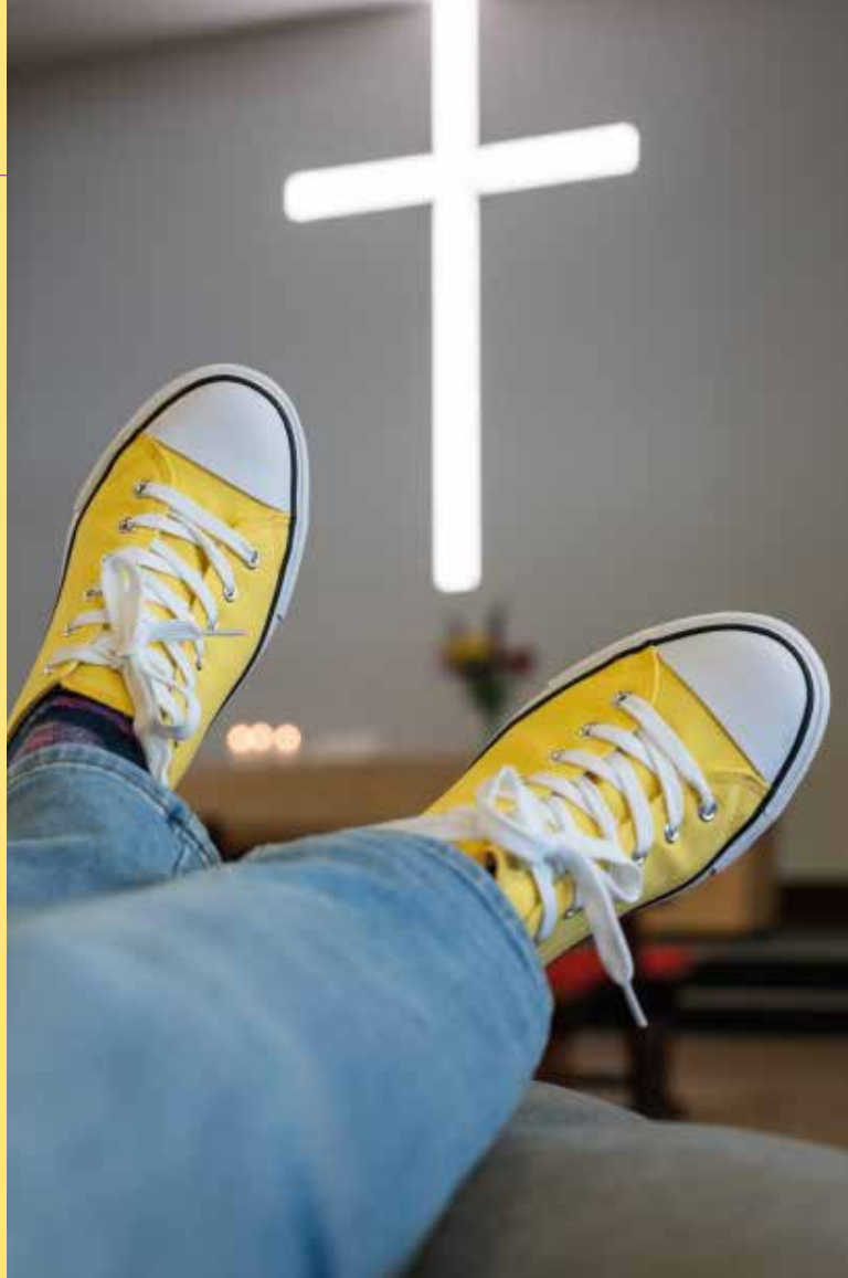
Die Pauluskirche gibt jungen Leuten Raum

Antwort: Der Schwerpunkt liegt in meinem zweiten Ausbildungsjahr beim Religionsunterricht. Ich werde neben der Kirchengemeinde Religion an zwei Gymnasien unterrichten.