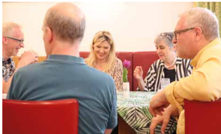
Unsere Gemeindemitglieder im Gespräch beim Future-Lab